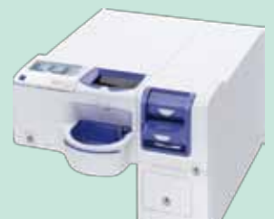
■セルフ決済向け釣銭機 GLORY RT-380・RAD-380